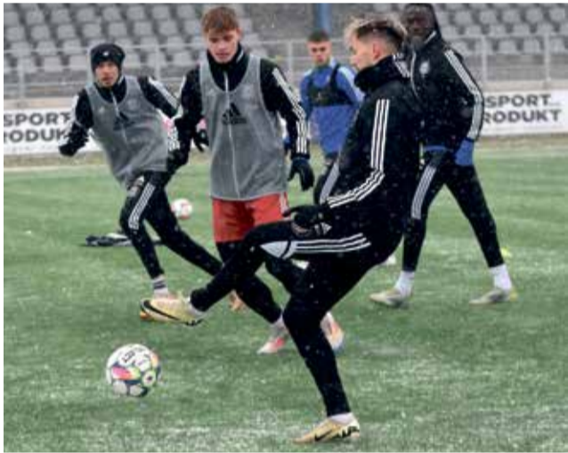
Fotbalisté SK Sigma Olomouc B se připravují na jaře s novým trenérem Romanem Westem.