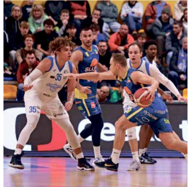
Basketbalisté BK Olomoucko pronikli poprvé do skupiny A 1.