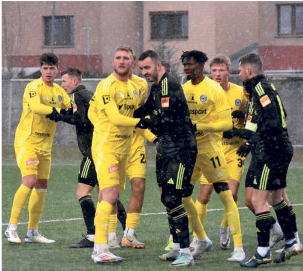
Fotbalisté SK Sigma Olomouc vyměnili domácí lednové klima za přívětivější počasí. Jsou na herním soustředění v Turecku.