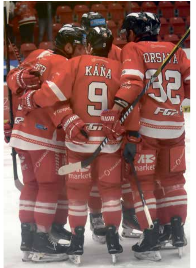
Hokejisté HC Olomouc pokračují v boji o předkolo play-off.

K. Vary: Hamalčík - Čihař, Černocho, Beránek, Mlýnska, Jaks, Jiskra, Griger - Procházka, Dlapa, Plutnar - Salsten, Iloomáki, Kofroň - Mamčícs, Moravec, Redlich - Štr, Koffer, Rulík. Trenér: Pavel Patera.