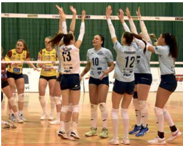
Volejbalistky VK Šantovka nedaly Liberci šanci a dál vedou extraligu.

Ve 20. kole Datart volejbalové extraligy žen proti sobě nastoupily ve slágu kola vedoucí Šantovka Olomouc a druhá Dukla Liberec. Olomouc vyhrála jasně 3:0, byť Liberec dokázal každý set v závěru zdramatizovat. Hanačky tak navýšily náskok na čele tabulky. Volejbalistky Sokola Šternberk konečně prolomily výsledkovou smůlu a po výborném výkonu vyhrály na palubovce Sokola Frýdek-Místek jasně 3:0.