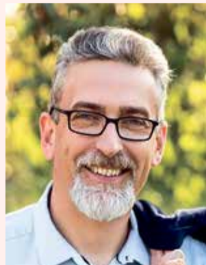
Mirek Žbánek primátor

Ptejte se vedení města Olomouce na e-mailové adrese otevrenaradnice@hanackyvecernik.cz a my Váš dotaz necháme zodpovědět!