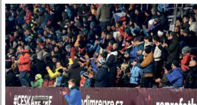
Na reprezentační zápas proti Gruzii bude Andrův stadion zaplněn.

„Také poslední letošní domácí zápas bude vyprodaný. Dokazuje to, že reprezentace má podporu fanoušků, a za to je zapotřebí jim poděkovat. Stejně jako v minulosti nepochybuji, že fanoušci v Olomouci vytvoří krásnou fotbalovou atmosféru, nejlépe s úspěšnou tečkou,“ řekl předseda FAČR Petr Fousek. ■