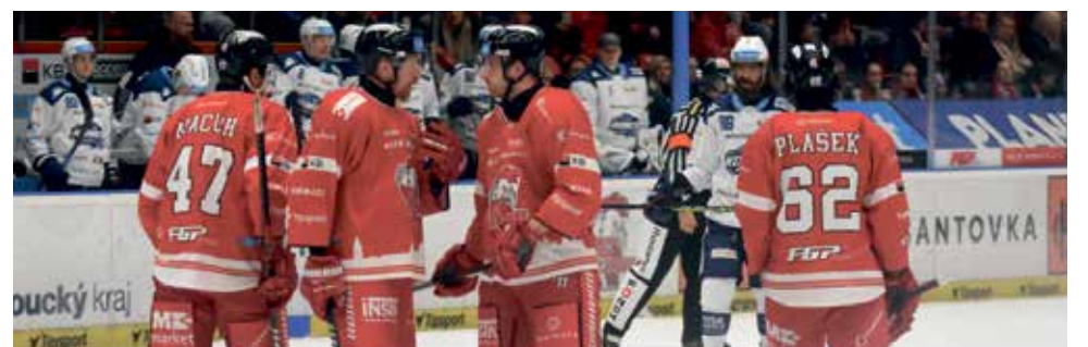
Hokejisté HC Olomouc jsou doma neporazitelní.

„Z utkání jsme mohli vytěžit víc, připravily nás o to nevyužité šance. Bodu si samozřejmě vážíme, v Olomouci se body nezískávají snadno. V polovině zápasu se hra srovnala, Olomouc tam už také začala vystrkovat růžky. Za stavu 2:1 měl Adam Zbořil tutovku, nedal ji a z protiútku soupeř tečovanou střelou vyrovnal. Musím pochválit kluky, kteří v prodloužení odpracovali oslabení ve třech. Nájězdy nám minule vyšly fantasticky, dneska se v nich radoval soupeř. Tam už je to o momentálním rozpoložení,“ uvedl kouč Brna Kamil Pokorný. ■ pel