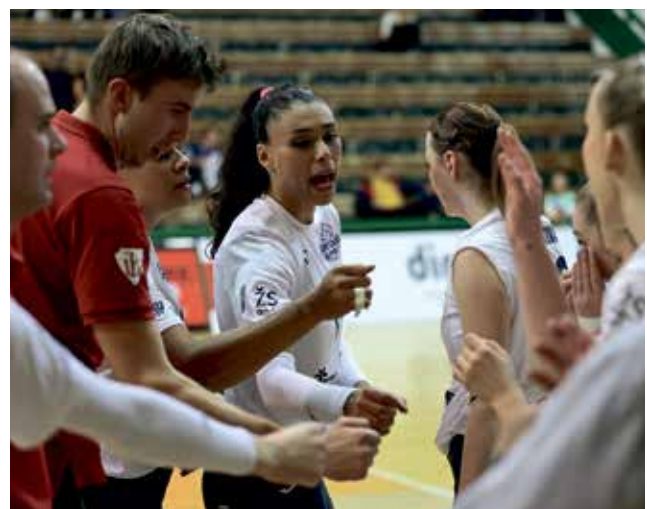
Volejbalistky VK Šantovka Olomouc dál vedou extralize.