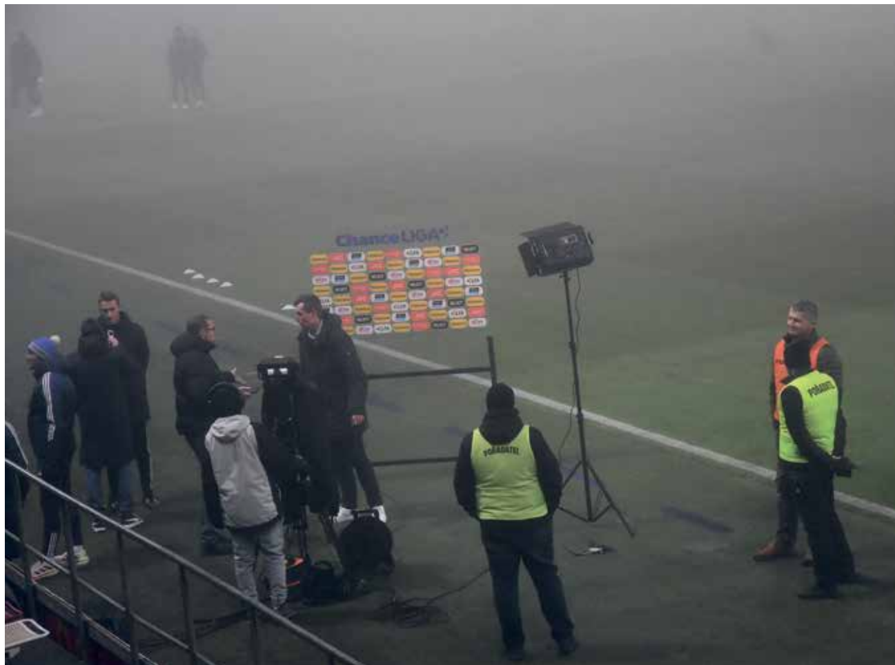
Mlha, která se dala krájet, byla příčinou odložení zápasu SK Sigma Olomouc proti Slovácku.