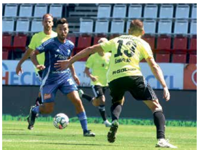
Béčko SK Sigma Olomouc zakončilo podzimní část soutěže prohrou v Prostějově.